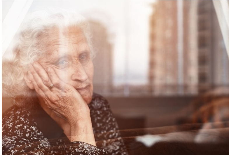
Solitud i aïllament