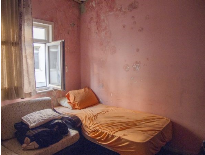
Precarietat econòmica i males condicions d'habitatge