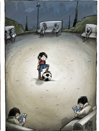
Empobriment de les relacions veïnals i de barri