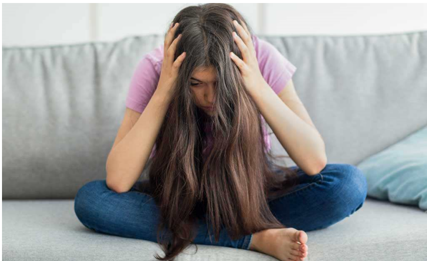
Malaltia mental i addiccions