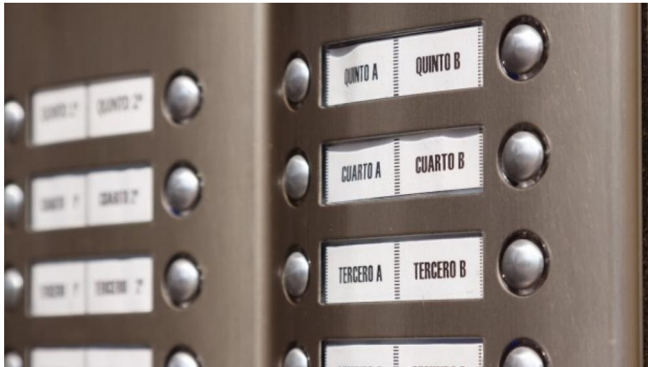
Individualisme i replegament en la vida privada